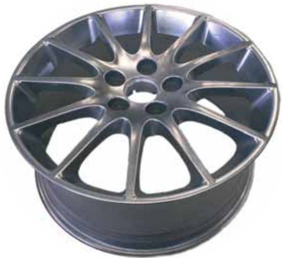
Felge vor- und feingeschliffen